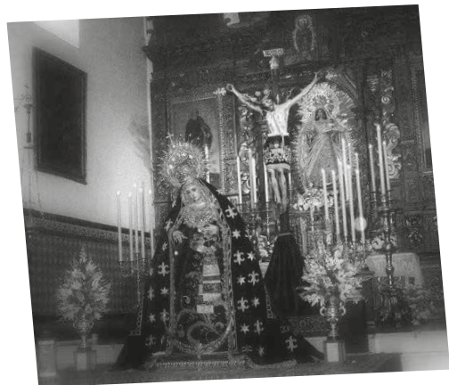
AÑO 2009. Culto extraordinario con motivo de la vuelta a nuestra Capilla.