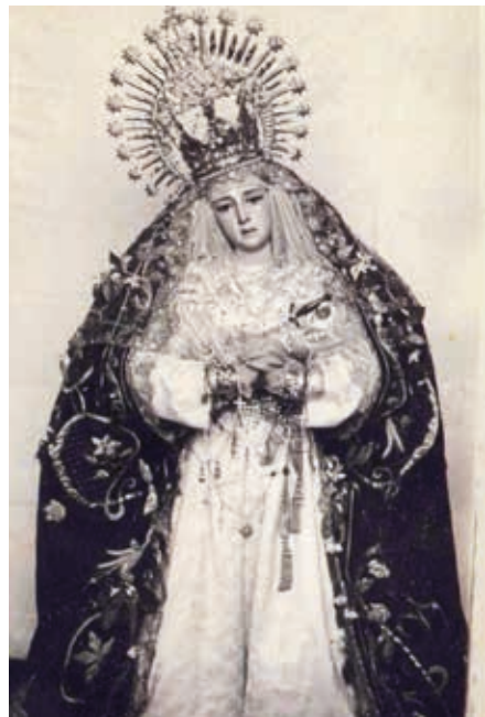
AÑOS 60. Santísimo Cristo de la Vera-Cruz y Nuestra Señora de los Dolores