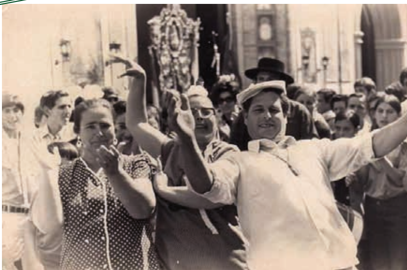
AÑO 1972. Curiosa foto del paso de la hermandad del Rocío de Umbrete por la Capilla. El Simpecado del Rocío de Benacazón se encuentra en la Capilla por obras en la Iglesia.