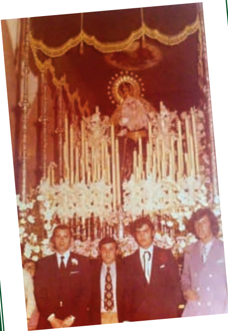
AÑO 1973. Capataces de la Hermandad. Morales el barbero, el Chispa, Pepe el Carpintero y Morales.