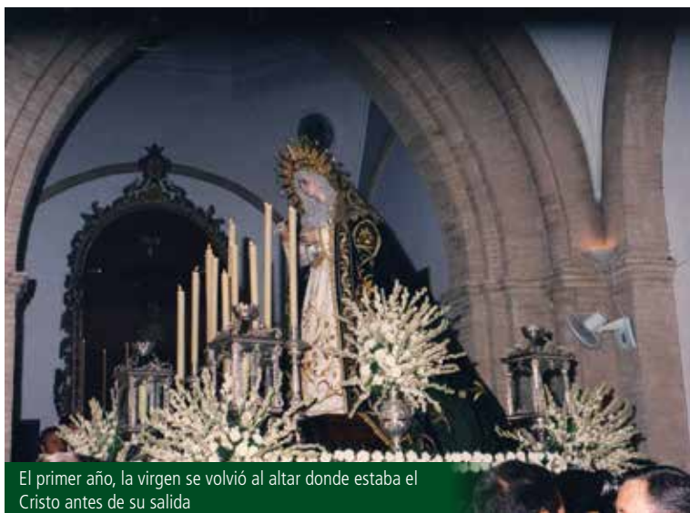
El primer año, la virgen se volvió al altar donde estaba el Cristo antes de su salida