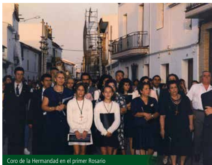
Coro de la Hermandad en el primer Rosario

Los rosales en flor y los lirios del campo, la rodean como en primavera. La vi tan bella como la aurora, cual sol refulgente en medio del cielo.