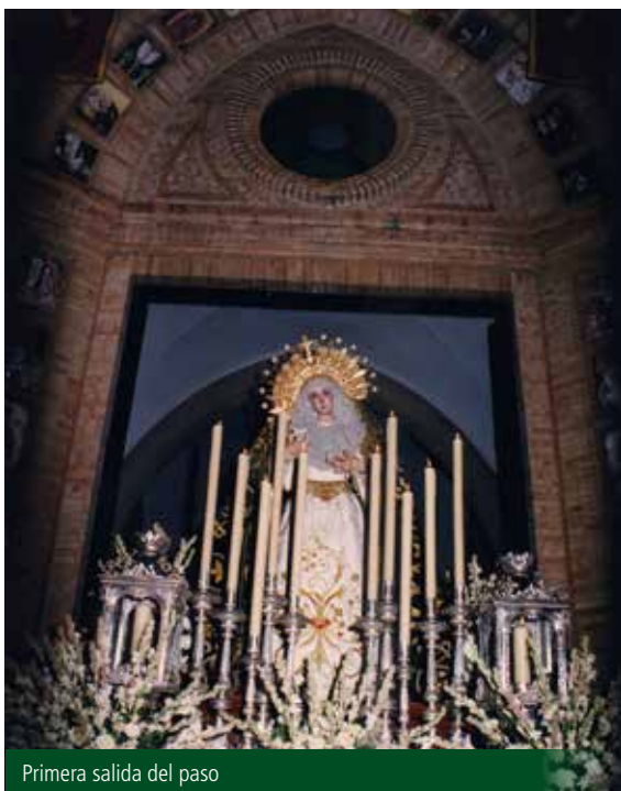
Primera salida del paso