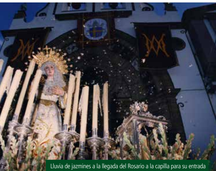
Lluvia de jazmines a la llegada del Rosario a la capilla para su entrada

llamaba al recogimiento, las meditaciones de Don Cristóbal calaron en lo más hondo de los corazones veracruzanos que saboreaban extasiados tanta belleza.